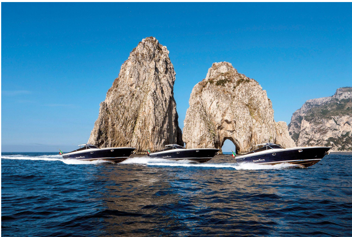
Immagine di copertina: la flotta, Pegaso I-II-III